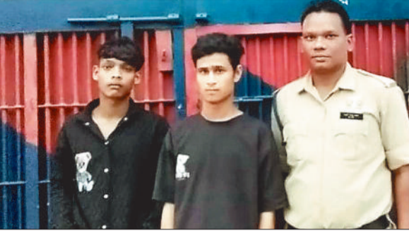
पुलिस गिरफ्त में आरोपी।