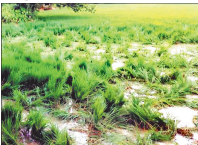
हाथियों द्वारा रोड़ी गई धान की फसल।

वर्नांचल क्षेत्र में बसने वाले लोगों द्वारा अपने खेतों में दिन-रात मेहनत कर धान की फसल तैयार कर चुके हैं और धान पकना भी शुरू हो चुका है और किसानों की मेहनत रंग दिलाने लगी है लेकिन अब किसानों की मेहनत पर हाथी पानी फेर रहे हैं। लगातार किसानों के खेतों में घुसकर उनकी खड़ी फसलों को चौपट कर रहे हैं जिससे किसान अपने आपको ठगा महसूस कर रहे हैं। भला आप सोच रहे होंगे कि ऐसा क्यों तो हम आपको बता दें कि भले ही किसानों को फसल क्षति के रूप में वन विभाग द्वारा मुआवजा तो दिया जाता है लेकिन यह राशि पर्याप्त नहीं होने से किसान अपने आपको ठगा महसूस कर रहे हैं और वर्नांचल क्षेत्र में बसने वाले लोग लगातार फसल क्षति की मुआवजा राशि बढ़ाने की मांग कर रहे हैं।