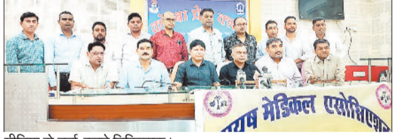
मीडिया से चर्चा करते चिकित्सक।