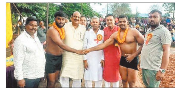
प्रतियोगिता का शुभारंभ करते पूर्व मंत्री एवं अन्य।

दशहरा पर्व के उपलक्ष्य में परंपरागत रूप से आयोजित विराट दंगल इस वर्ष भी जिले में आकर्षण का केंद्र बना रहा। जिले के 15 ब्लॉक में हुए इस आयोजन में न केवल छत्तीसगढ़ बल्कि उत्तर प्रदेश, बिहार, मध्यप्रदेश और झारखंड से आए नामी पहलवानों ने अपने दांव-पेंच से दर्शकों को मंत्रमुग्ध कर दिया। दंगल में पहलवानों की भिड़ंत देखने हजारों की संख्या में लोग मैदान में जुटे। अखाड़े में जब पहलवानों ने कुश्ती के पारंपरिक दांव चलाए तो दर्शक तालियों की गड़गड़ाहट और उत्साहजनक नारों से गूंज उठे। रोमांचक मुकाबलों को देखने का आनंद हर वर्ग के दर्शकों ने लिया।