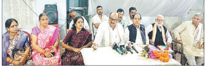
मीडिया से चर्चा करते पूर्व राजस्व मंत्री एवं अन्य।

सीबीआई की चार्जशीट से साफ है कि बिरनपुर मामले में भाजपा ने सांप्रदायिक और जातीय कार्ड खेला था। बिरनपुर मामले में सीबीआई ने विशेष अदालत में अपनी चार्ज शीट दाखिल किया है। सीबीआई की चार्ज शीट के तथ्य भी सार्वजनिक हुए हैं। सीबीआई ने चार्ज शीट में घटना का विकृत विवरण दिया है, उनकी विवेचना में स्पष्ट हुआ है कि यह घटना क्रम दो बच्चों के झगड़े से शुरू होकर दो परिवारों तक पहुंचा और बाद में यह दो समुदायों का झगड़ा बन गया। सीबीआई ने अपनी जांच में यह भी पाया कि इस घटना में कोई राजनैतिक षड़यंत्र नहीं था, यह एक