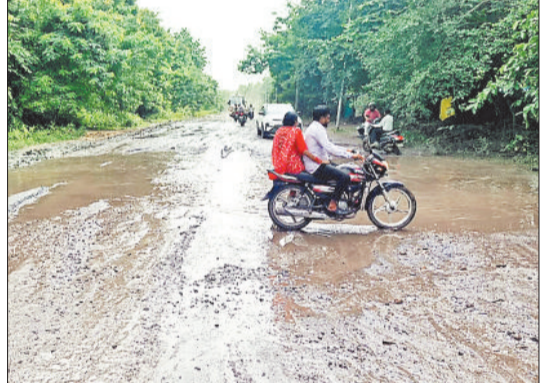
जर्जर सड़क जो बन चुकी है तालाब।