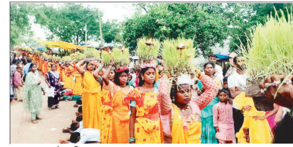
कलश यात्रा में शामिल श्रद्धालु।